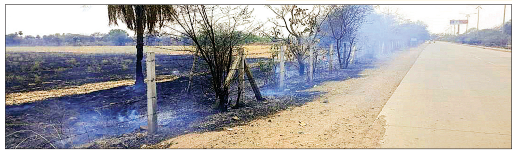
सीहोर। किसानों ने सैकड़ोंखेड़ी रोड पर नरवाई में आग लगा दी। आग से खेतों के मेढ़ पर लगे कई हरे-भरे पेड़ जल गए।

उसके विरुद्ध कार्रवाई की जाएगी। कृषि विज्ञानी डॉ. केएस यादव का कहना है कि नरवाई जलाने से धुआं निकलता है जिससे वायुमंडल में प्रदूषण होता है। नरवाई की आग से भूमि में रहे वाले लाभकारी बैक्टीरिया, सूक्ष्म जीव जलकर नष्ट हो जाते हैं। खेतों की मिट्टी कड़क हो जाती है, जिससे उपजाऊ क्षमता कम हो जाती है। नरवाई जलाने से ग्लोबल वार्मिंग में असर पड़ता है। यह वायुमंडल के लिए खतरनाक है। किसान नरवाई जलाने की जगह यदि स्ट्रॉरीपर यंत्र का उपयोग करे तो ज्यादा बेहतर है। इस यंत्र से नरवाई से भूसा तैयार किया जा सकता है। इससे भूसे की मात्रा बढ़ेगी। गेहूँ कटाई के दौरान किसान नीचे से कटाई करें। हम अपने खेत में फसल कटने के बाद नरवाई का भूसा बना लेते हैं।