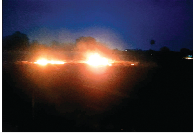
सीहोर। गणेश मंदिर रोड पर रविवार नरवाई की आग ने पेड़ों को अपनी चोंट में ले लिया। जिसमें एक बड़ा बरसाद का पेड़ भी शामिल था।

नरवाई जलाने से किसानों को भी बहुत नुकसान है। नरवाई जलाने से इसके धुएँ की वजह से मनुष्य जीवन और स्वास्थ्य पर भी प्रतिकूल प्रभाव डालता है। आग की वजह से मिट्टी के मित्र जीवी कीट खत्म हो जाते हैं, इससे उपजाऊ पन भी प्रभाव पड़ता है। इससे पर्यावरण भी दूषित होता है। इसके बाद भी किसान खेतों को साफ करने के लिए नरवाई में आग लगा रहे हैं। आपदा अधिनियम के तहत कार्रवाई का प्रावधान : नरवाई में आग लगाए जाने पर आपदा प्रबंधन अधिनियम के तहत संबंधितों पर कार्रवाई का प्रावधान है। इसके तहत संपूर्ण जिले की सीमा में कोई भी व्यक्ति नरवाई नहीं जलाता है तो